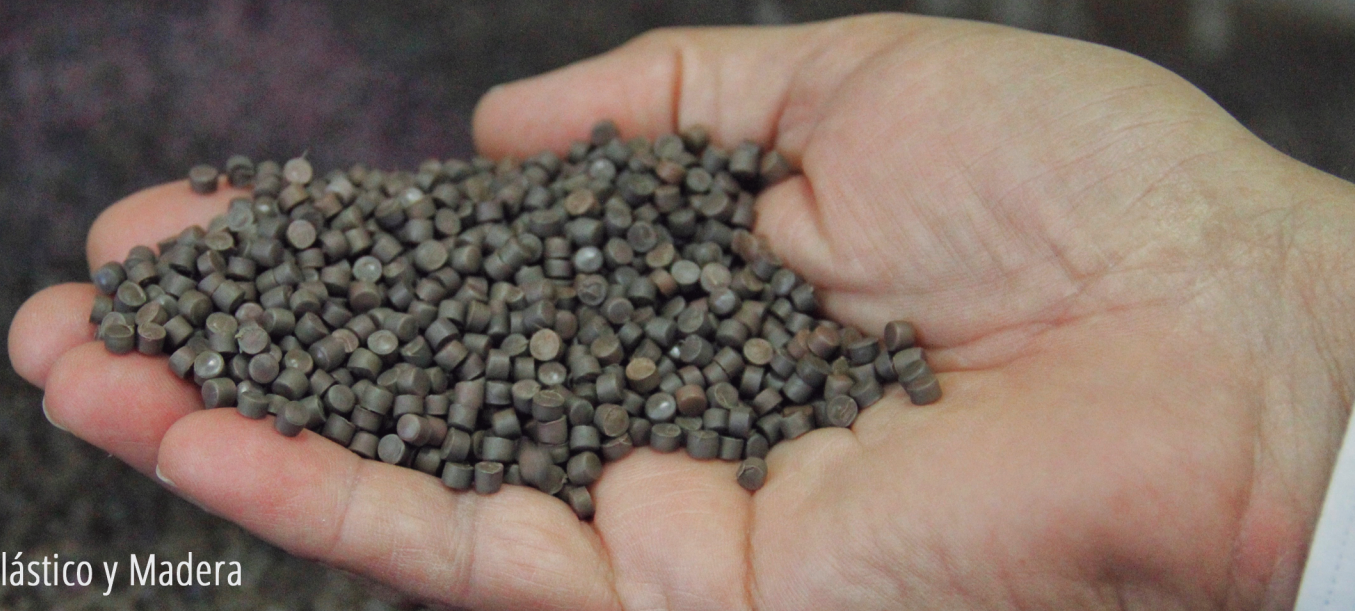
WPC Compuesto de Plástico y Madera

Los equipos de Extrusión de WPC INTYPE permiten la elaboración de tubería y perfiles de materiales obtenidos de desechos orgánicos. El WPC (Wood Plastic Compound), es una mezcla de plástico y madera, esto reduce los costos al utilizar menor cantidad de materias primas vírgenes y su vez disminuye el impacto ambiental.